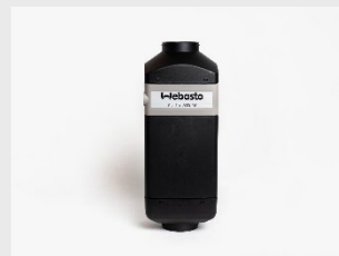
AT 2000 STC