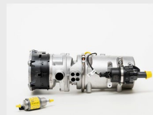
Thermo PRO 90