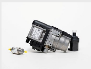
Thermo ECO 50