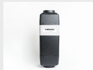
AT EVO 55