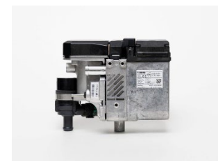
Thermotop E / C